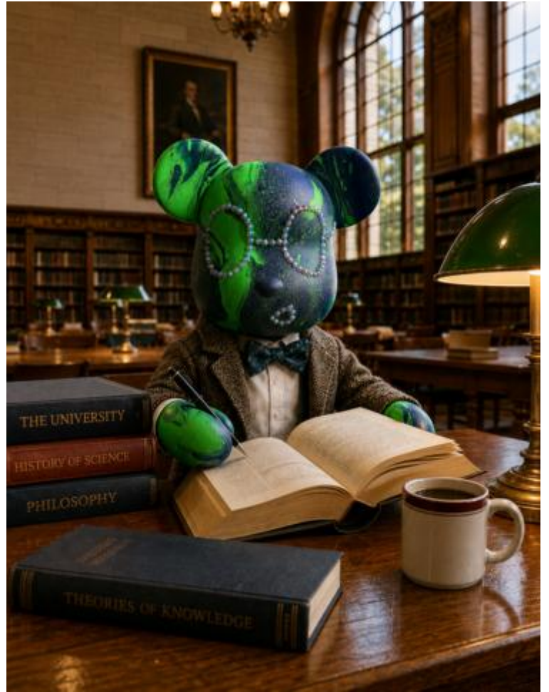
"NANUQ", Februar 2026