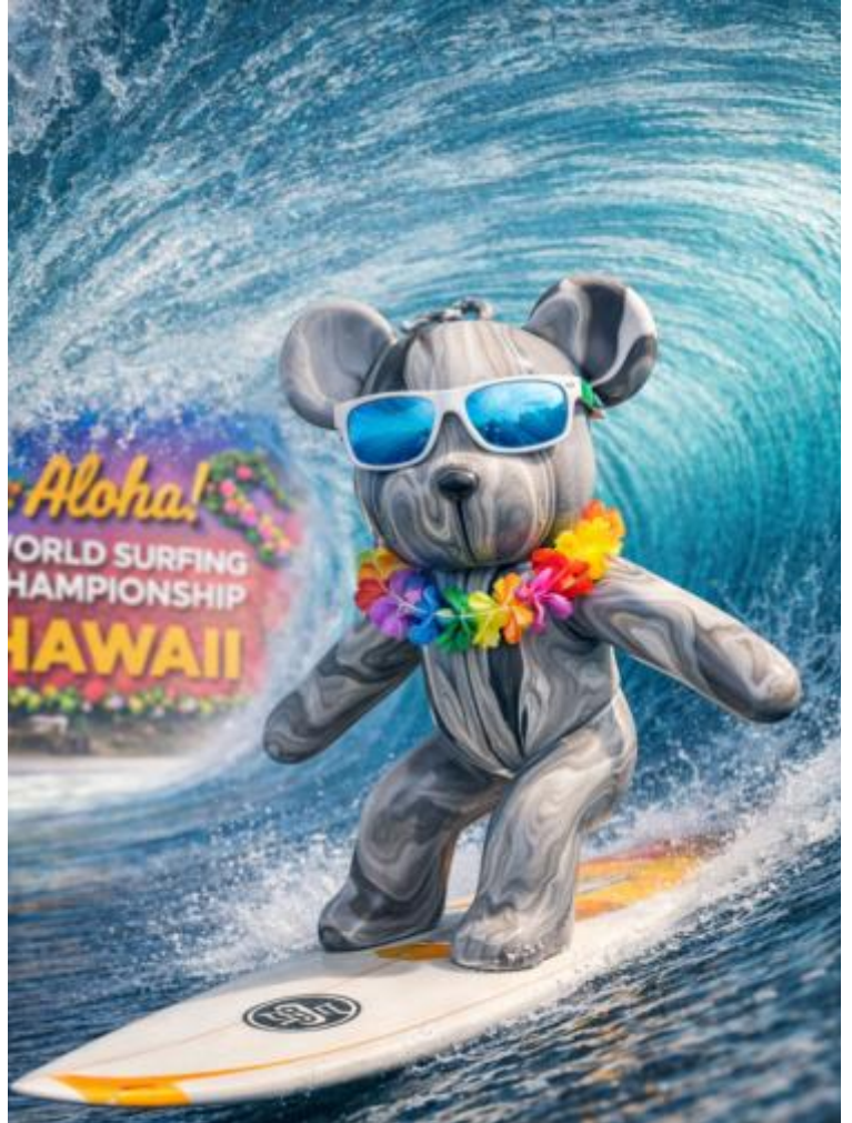
"BLACKY", Februar 2026