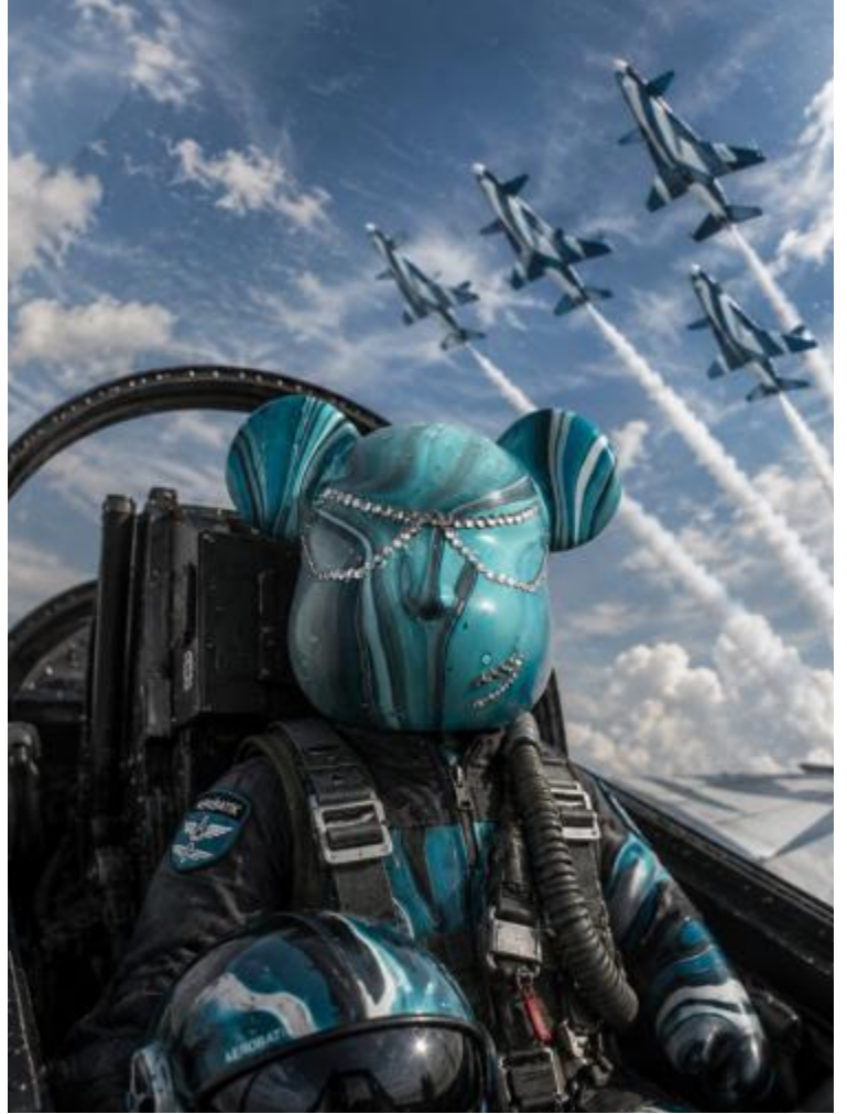
"BLUE", Februar 2026