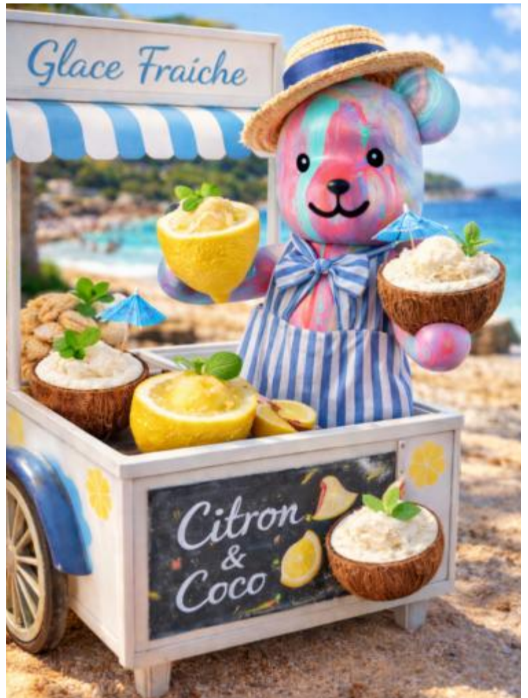
"LUCIEN GLACE", März 2026