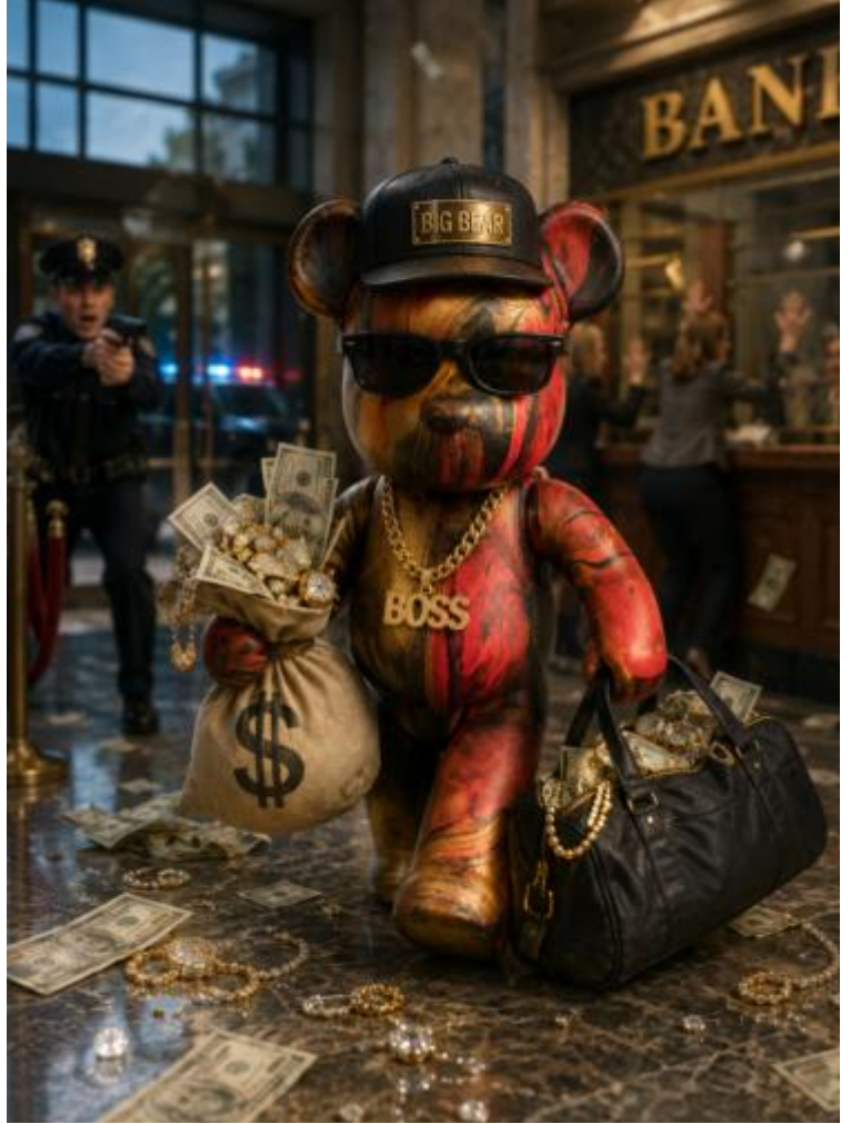
"BIG BOSS BEAR", Februar 2026