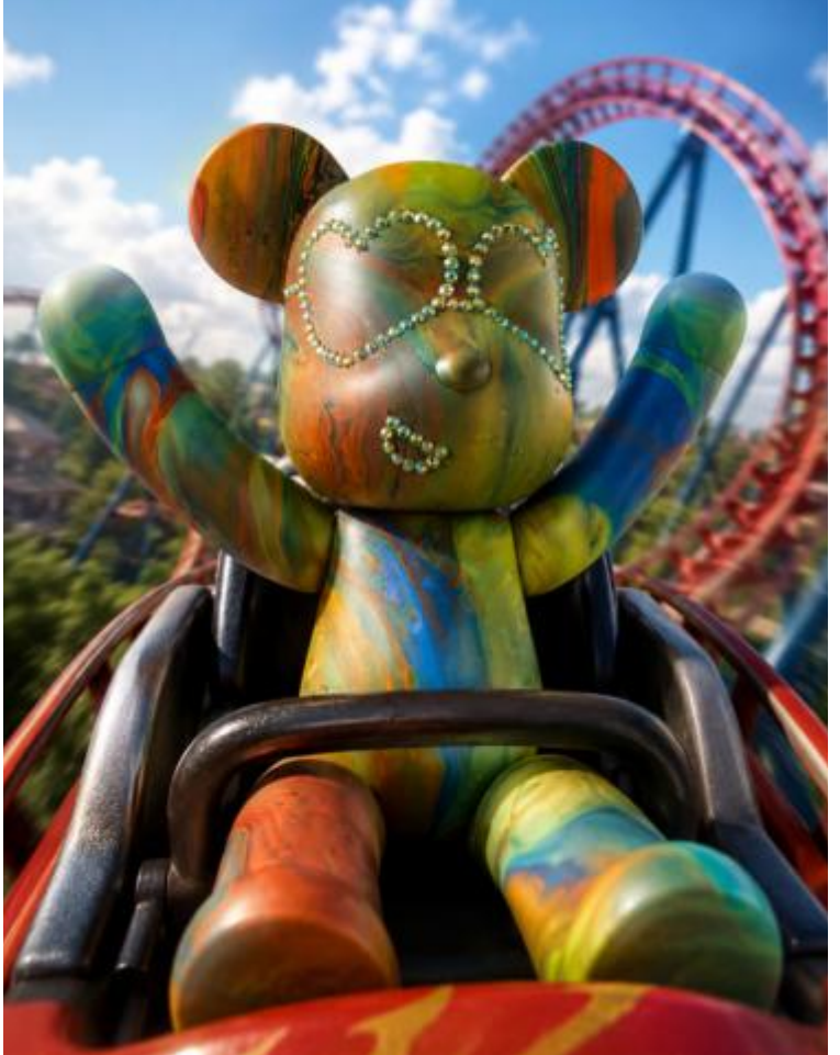
"LUMINO", Februar 2026