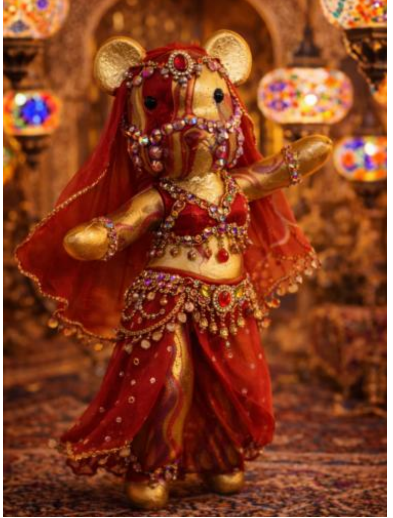
"Zahira al-Nur", Februar 2026