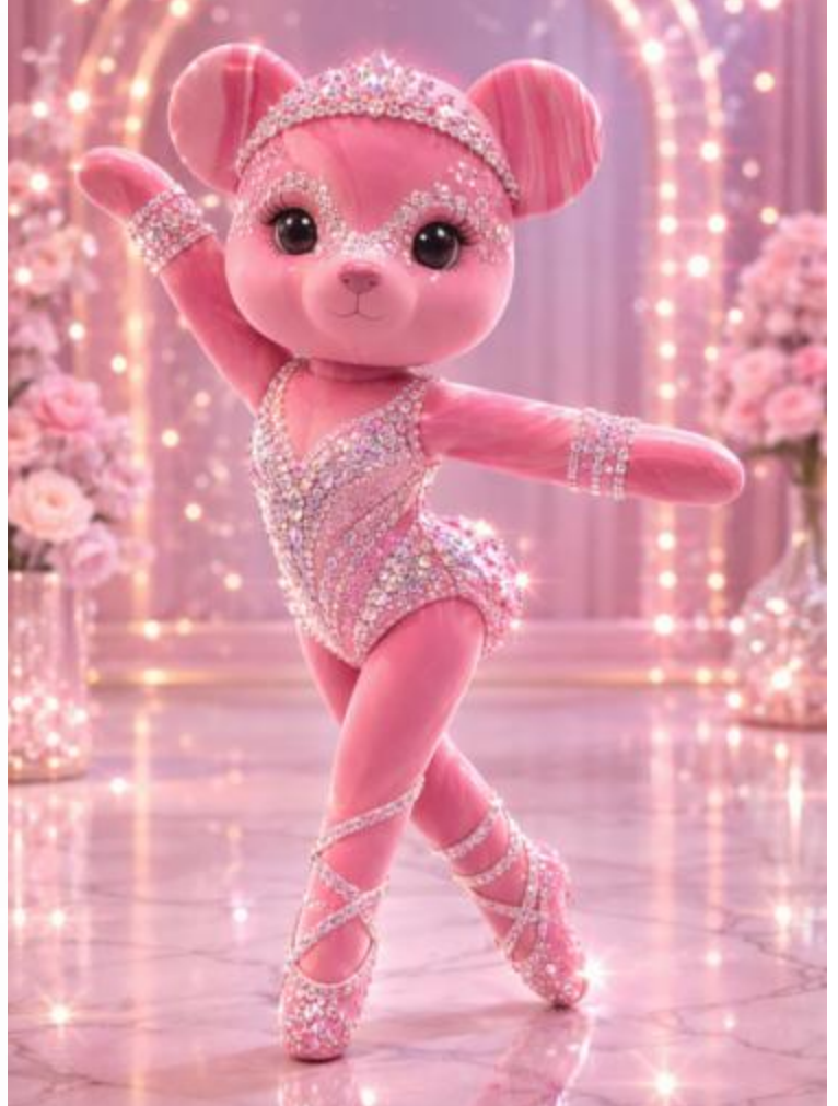
"ROSELLIA", Mai 2026