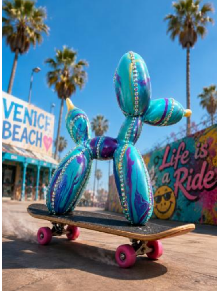
"RYDER", Februar 2026