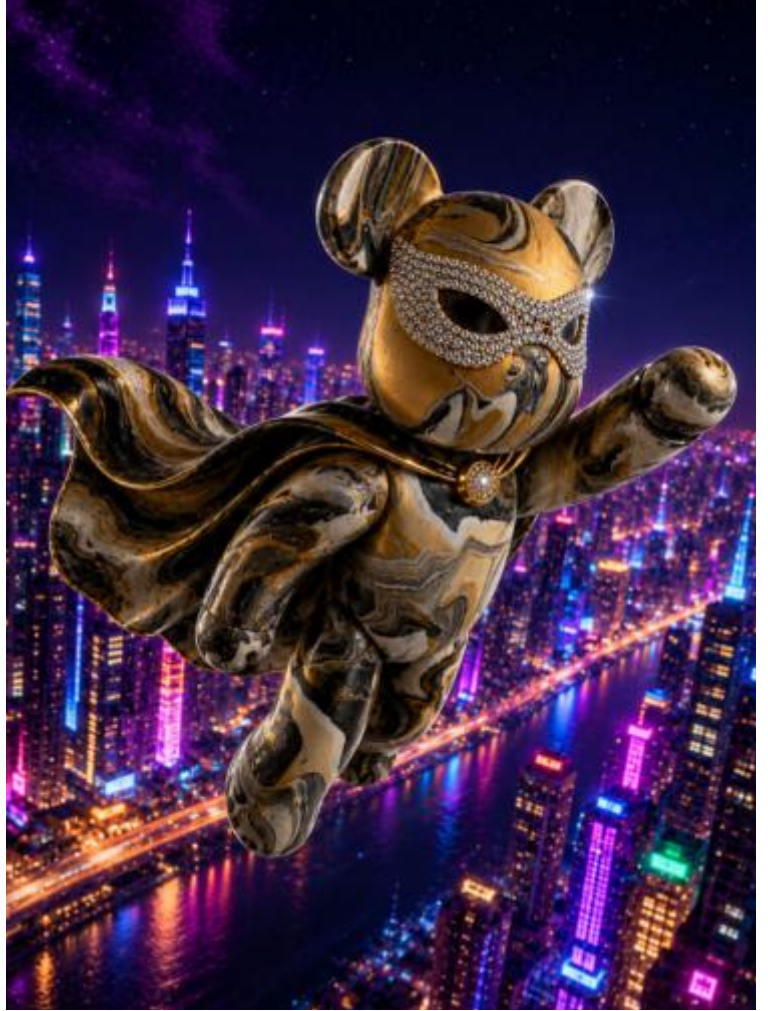
"Nocturon", März 2026