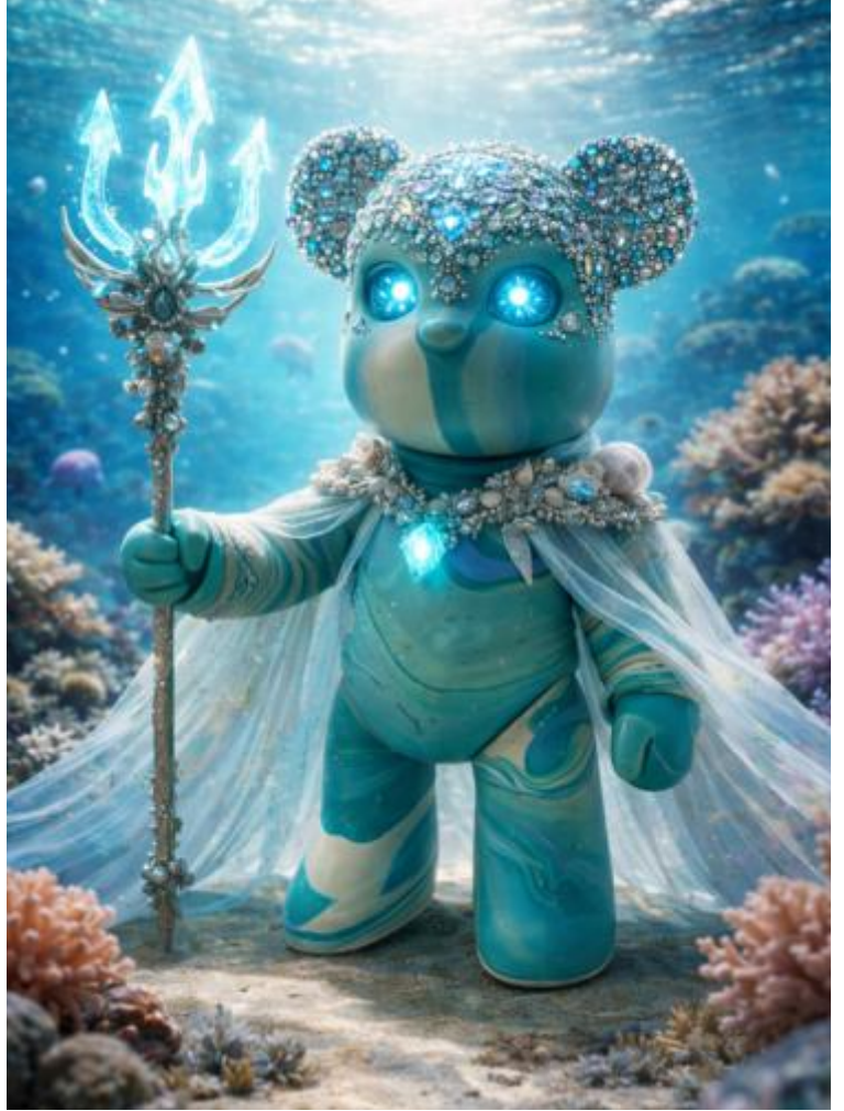
"NERIVAAN", Mai 2026