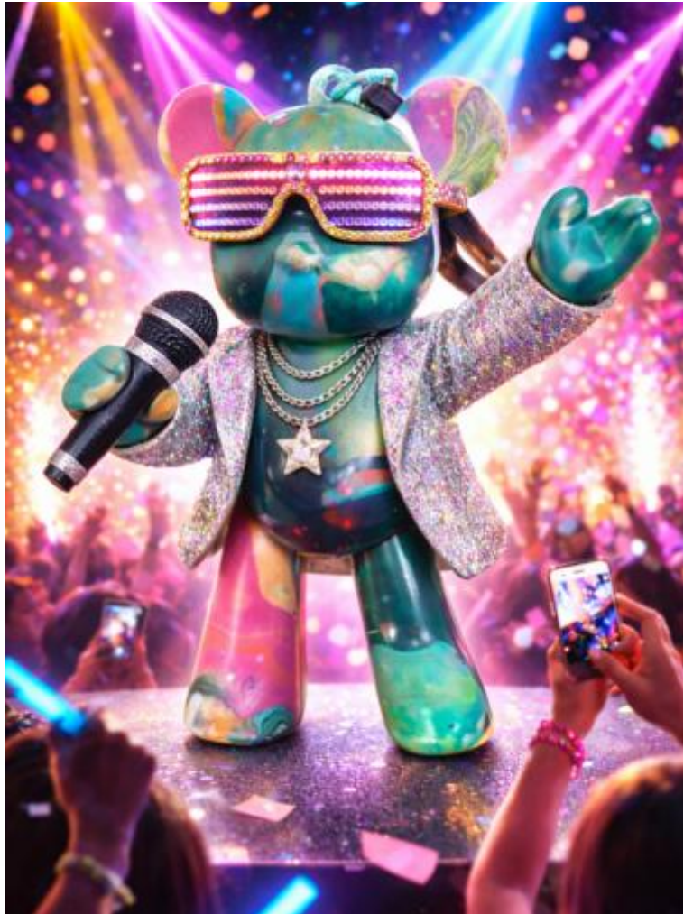
"PRINCE X", Februar 2026