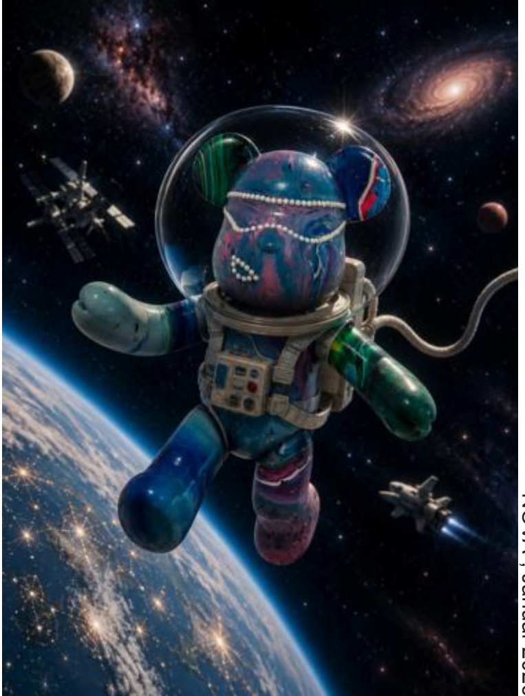
"NOVA", Januar 2026