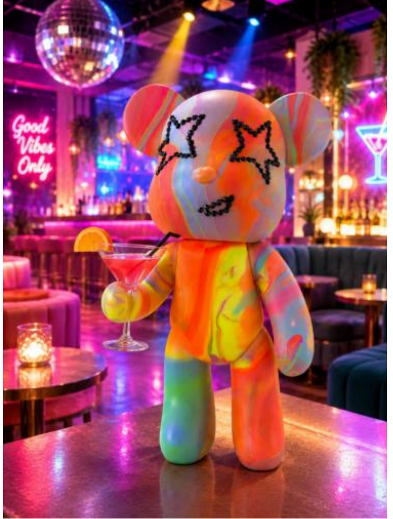
"JACE", Februar 2026