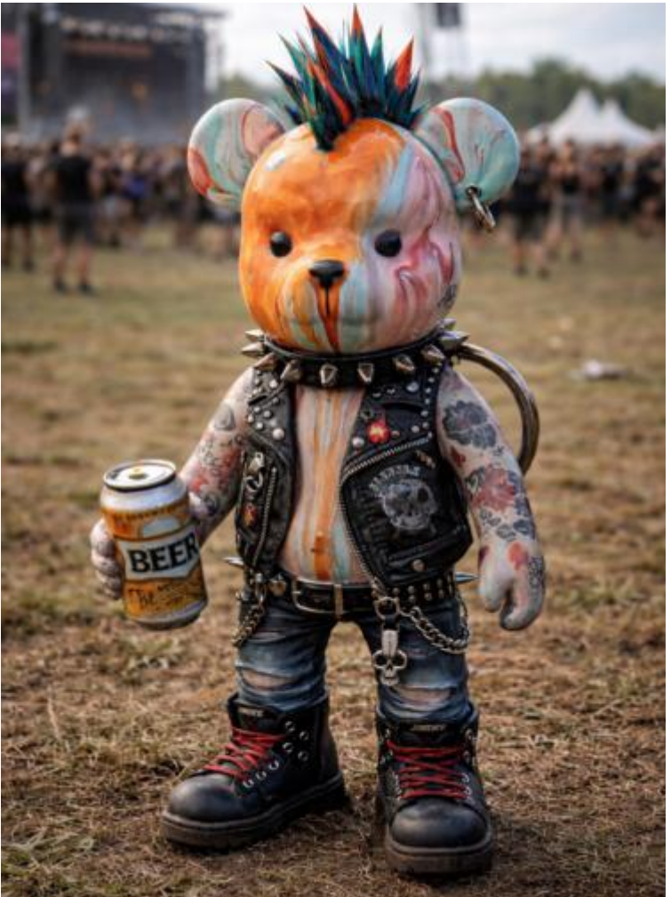
"RUSTY RIOT", Februar 2026